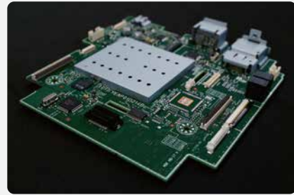
이미지 : 게임기